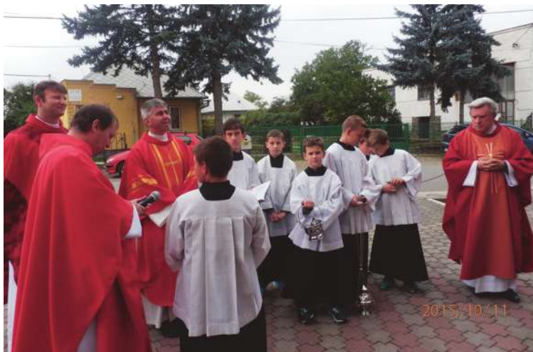
Záver misii - požehnanie misijného kríža.

Toto všetko, čo sme v tieto dni prežili a cítili, sa nemusí skončiť. Veď predsa každý z nás sa rád delí o to, čo ho teší. A práve radosť a láska rozdávaním rastie. Nechcime teda čakať, že nám vždy len niekto niečo dá, že budeme len prijímať, ako sme to robili tento týždeň. Boh nás všetkých posielal, aby sme radostné posolstvo Jeho lásky prinášali všetkým ľuďom, aby ostatní, ktorí neveria, mohli povedať: Pozrite, ako sa milujú.