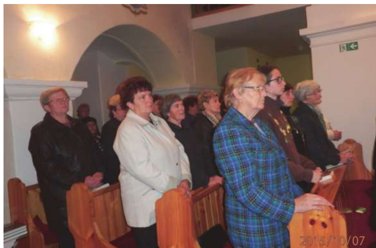
Večerná svätá omša - pohľad medzi ľuďmi.

Avšak počas misií bol náš kostol plný, až tak, že si mnohí museli celú omšu odstáť. Boli to úplne bežné dni, keď ľudia chodia do práce, deti do školy, každý z nás má povinností vyše hlavy. Navyše sa nikto nikam neponáhľal, nikomu nevadilo, že svätá omša, prípadne nejaký konkrétny program netrvá len necelú hodinku. Práve naopak, cítili sme sa tu veľmi dobre, dokonca niekedy až tak dobre, že nám bolo ľúto, keď sa program skončil a my sme sa museli vrátiť domov, do našej možno monotónnej každodennosti.