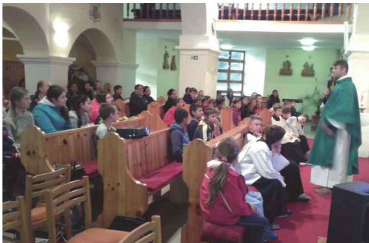
Svätá omša pre deti.