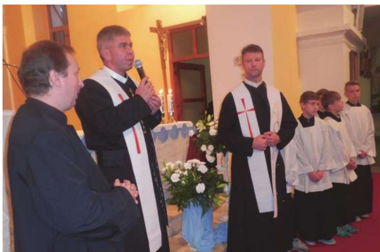
Úvod misií - privítanie misionárov a odovzdanie štól misionárom.

Ježiš pred svojím nanebovstúpením povedal: „Chodte do celého sveta a hlásajte evanjelium všetkému stvoreniu.“ (Mk 16,15)