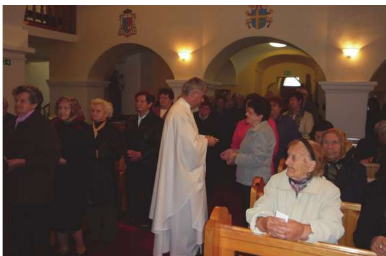
Udeľovanie sviatosti pomazania chorých.

Toto všetko, čo sme v tieto dni prežili a cítili, sa nemusí skončiť. Veď predsa každý z nás sa rád delí o to, čo ho teší. A práve radosť a láska rozdávaním rastie. Nechcime teda čakať, že nám vždy len niekto niečo dá, že budeme len prijímať, ako sme to robili tento týždeň. Boh nás všetkých posielal, aby sme radostné posolstvo Jeho lásky prinášali všetkým ľuďom, aby ostatní, ktorí neveria, mohli povedať: Pozrite, ako sa milujú.