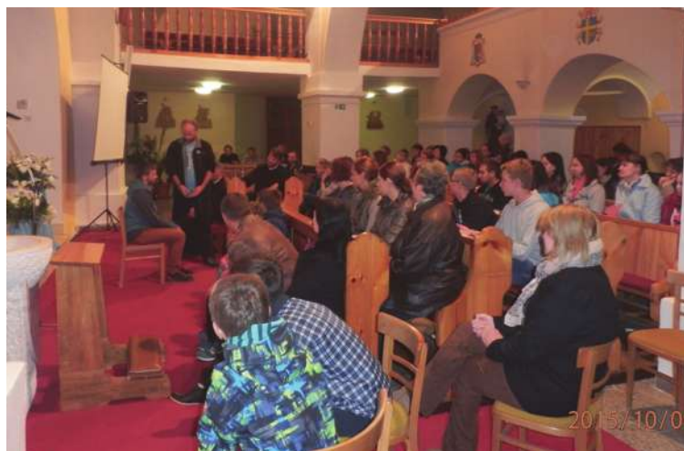
Vystúpenie mladých zo spoločenstva Rieka života z Podolíncu.

po starom. Zopár mladších či starších ľudí, zopár stareniek, zachraňujúcich situáciu počas týždňa. Kam sa všetci vytratili? Naozaj sme takí sebestační, že počas roka už Boha tak často nepotrebuje? Že nám stačí prísť len na nedeľnú svätú omšu? Alebo je to skutočne len plnenie si svojej kresťanskej povinnosti a vôbec nám nejde o to, aby sme sa stretli so živým Bohom, živým Kristom, ktorý nás tak veľmi miluje?