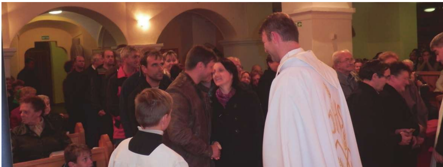
Obnova manželských sľubov.