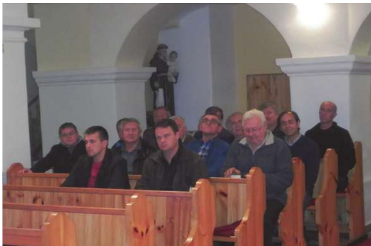
Stretnutie s mužmi.

Čo ale bude ďalej? Vráti sa všetko do starých koľají? Opäť sa každý uzavrie sám do seba, do vlastných problémov? Opäť sa vytratí radosť z našich srdiec?