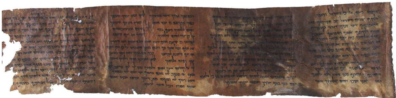
Jeden z najstarších známych záznamov Desatora, pochádzajúci z 1. storočia pred Kristom.

Boží príkaz zakazoval akékoľvek zobrazovanie Boha ľudskou rukou. A predsa už v Starom zákone Boh dovolil zhotovovať obrazy, ako symboly napr. medený had, archa zmluvy. Koncil v Nicei r. 787 odôvodnil uctievanie obrazov Ježiša Krista, ale aj Bohorodičky, anjelov a všetkých svätých. Kto uctieva obraz, uctieva osobu, ktorá je na ňom namaľovaná.