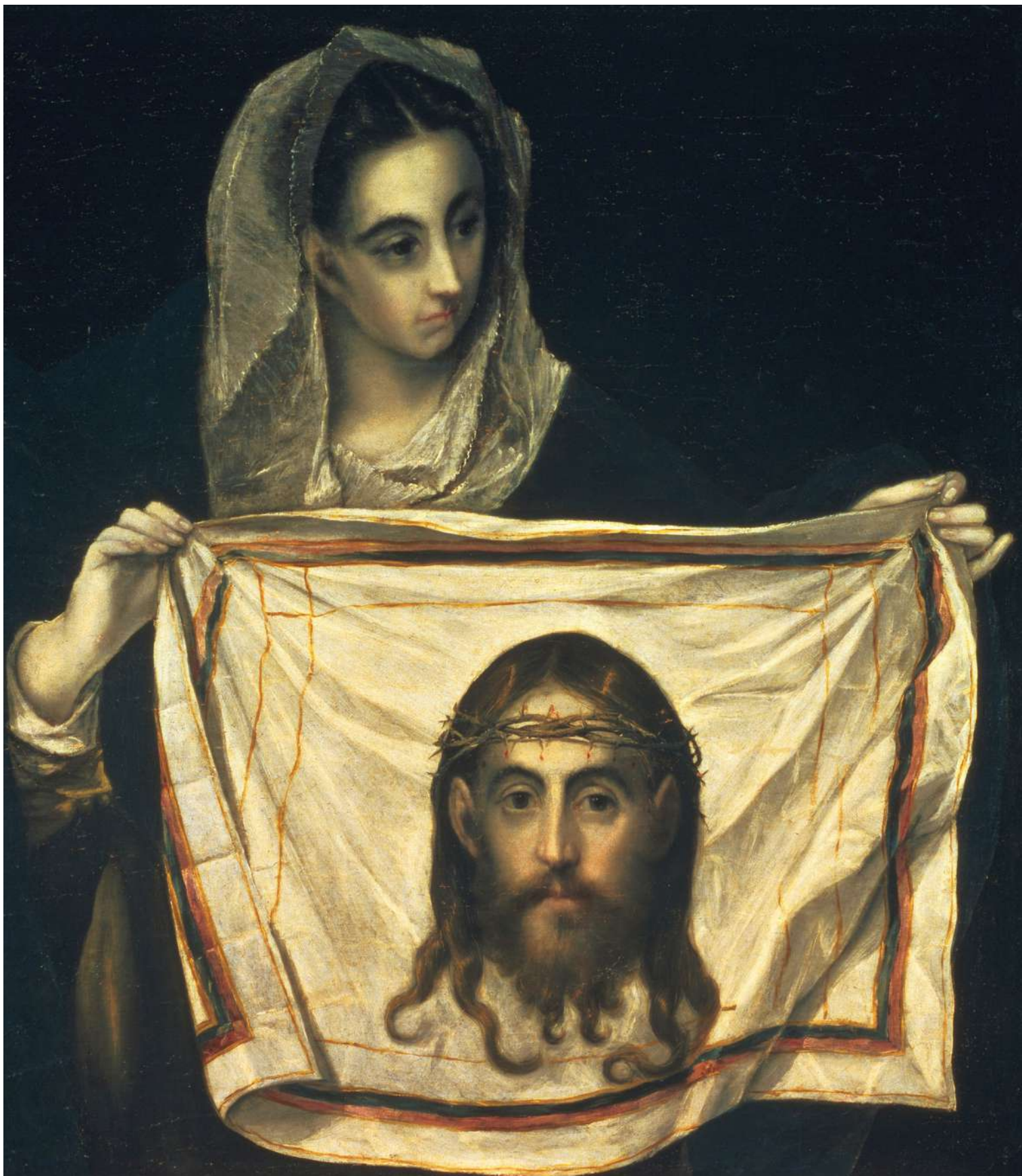
EL GRECO: VERONIKA S ŠATKOU, 1580, OLEJ NA PLÁTNE