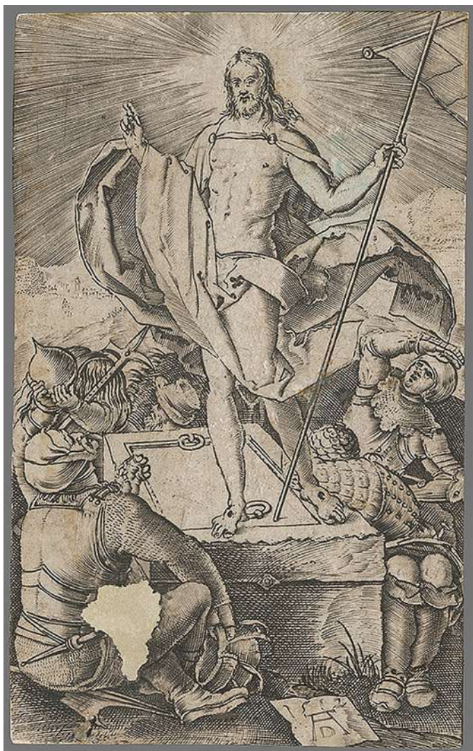
Rytina Albrechta Dürera Zmŕtvychvstanie Ježiša Krista z roku 1512

Aj v živote každého z nás sú obdobia, keď pochybnosti rozličného druhu oslabujú našu vieru v zmŕtvychvstalého Krista. V pochybnostiach a nasledujúcej neistote preto radšej utekáme tam, kde sa cítime ako-tak istí, podobne ako apoštolí k rybolovu. No majme odvahu uveriť svedectvu týchto mužov a Cirkvi a túžme vo svojom srdci po stretnutí so zmŕtvychvstalým Kristom. Poprosme ho, aby zoslal Ducha Svätého do našich srdiec, aby sme mali odvahu nielen prekonať pochybnosti žitou stálou a pevnou vierou vo vzkrieseného Krista, ale aby sme jeho zmŕtvychvstanie ohlasovali aj iným. Ved' keď on vstal z mŕtvych, vstaneme aj my! Ako ostal na tretí deň jeho hrob prázdny, aj naše hroby sa vyprázdnia, lebo človek je povolaný k životu a pre večné šťastie.