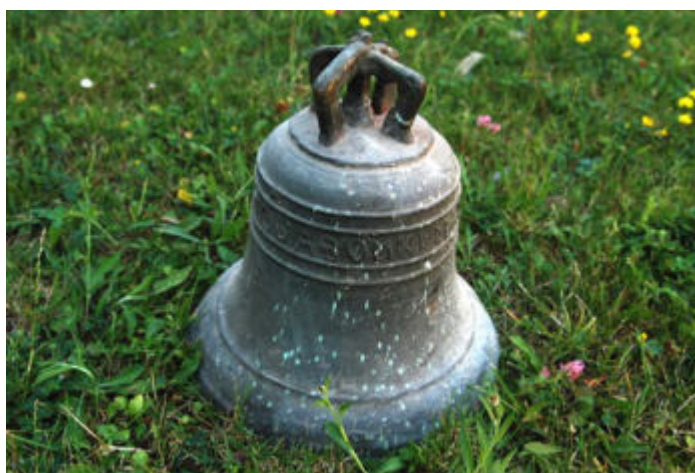
Zvon z roku 1641