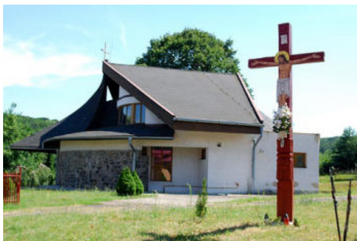
Drevený zdobený kríž z roku 1921

foto autor + reprofoto z publikácie Suché, 2016