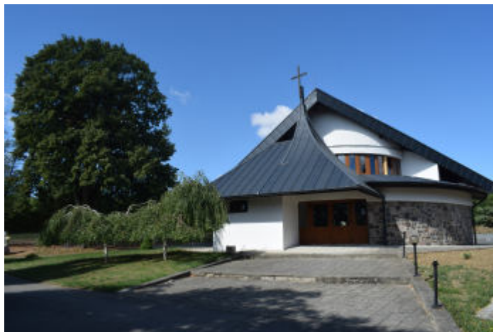
Dom smútku v Suchom bol postavený v rokoch 1998 - 2002 a stal sa ďalšou dominantnou obce.

Suché sa v starých dokumentoch uvádza už v roku 1266, nedávno teda oslavovalo 750. výročie prvej písomnej zmienky. Vždy to bola obec zmiešaná – ako konfesiónálne, tak i národnosťou obyvateľov, ktorí tu žili. Zaujímavosťou je, že rímskokatolícki veriaci patrili pod farnosť v Nižnom Hrušove, gréckokatolíci pod farnosť Lesné a reformovaní pod farnosť Pozdišovce. Všetci bez rozdielu to teda mali do kostola hodne ďaleko – v Suchom chrám dlho nemali. Postavili si ho až v rokoch 1773 – 1782 gréckokatolíci. Prvý chrám bol drevený a dlho nevydržal, pretože svojou veľkosťou nepostačoval potrebám