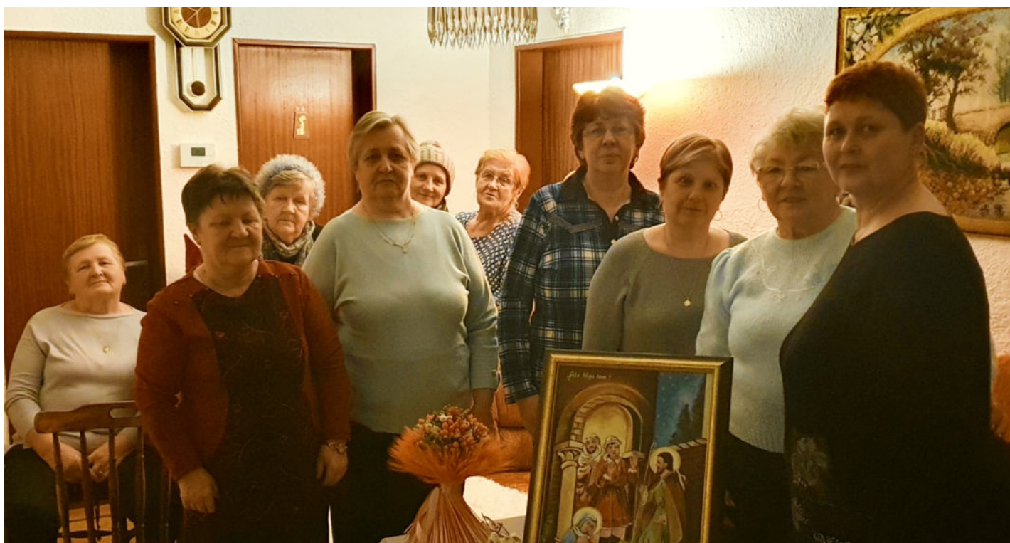
Foto z predvianočného deviatnika 2022